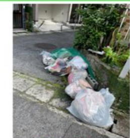
ごみは、「指定の袋」で出しましょう!