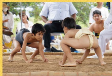
集落ごとに土俵があるほど、奄美では小さい頃から相撲が親しまれている。