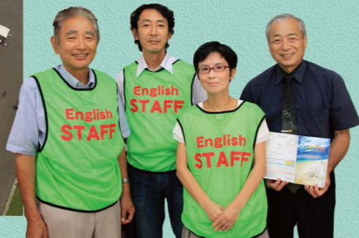
通訳ガイドとして活動が期待される奄美国際懇話会のメンバー

奄美は昔から「道の島」として、地理的にも歴史的にも知られてきました。奄美市では、観光船専用バースが新設されたのを機会に、世界のクルーズ船も寄港できるようになり、更なる受け入れ態勢の充実を目指しています。