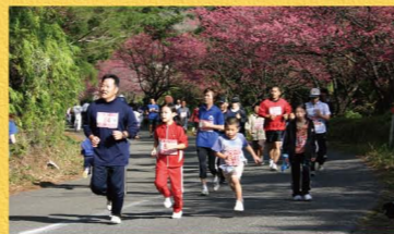
緋寒桜を見ながら、奄美観光桜マラソン