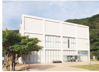
奄美市立奄美博物館