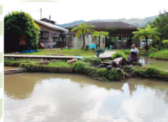
本場奄美大島紬泥染め公園