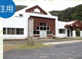
奄美市木工芸センター