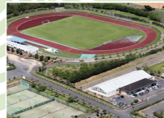
奄美市太陽が丘総合運動公園