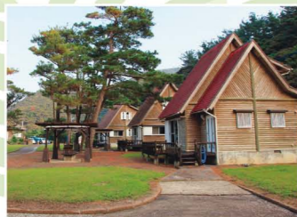
うちうみ公園バンガロー