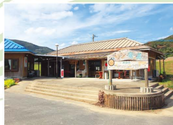
奄美市住用地域特産物販売所