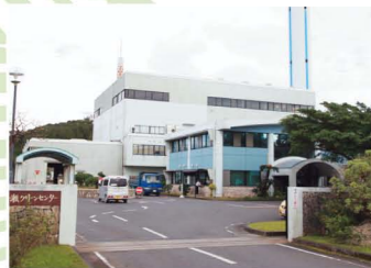
名瀬クリーンセンター