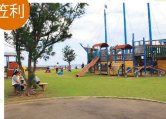
あやまる岬観光公園