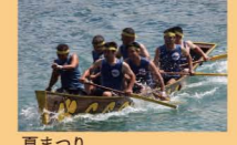
パッションフルーツ