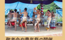
敬老会や豊年祭の開催