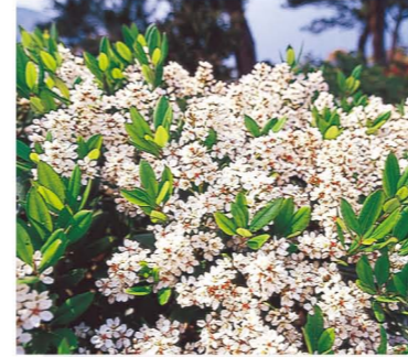
シャリンバイ Japanese Hawthorn