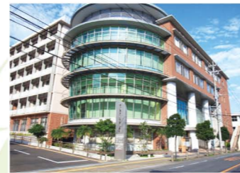
鹿児島県立奄美図書館