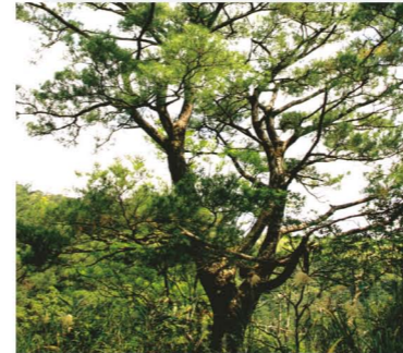
リュウキュウマツ Ryukyu Pine