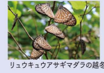
リュウキュウアサギマダラの越冬