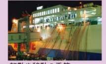
回転や移動の季節