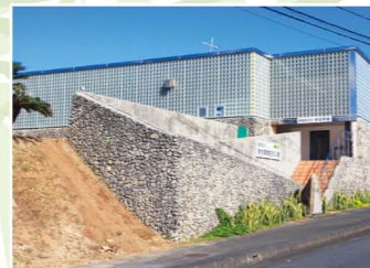
奄美市宇宿貝塚史跡公園