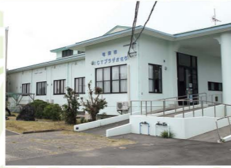
奄美市ICTプラザかさり