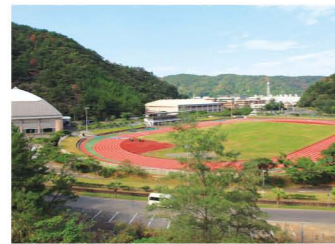
奄美市名瀬運動公園