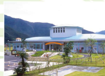
黒潮の森マングローブパーク