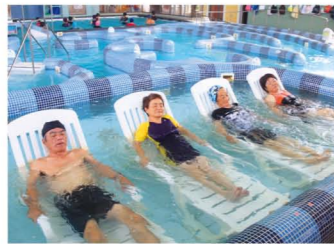
タラソ奄美の竜宮