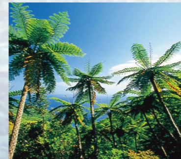
ヒカゲヘゴ Flying Spider-Monkey Tree Fern