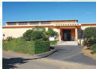
奄美市歴史民俗資料館