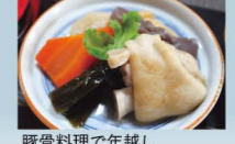
豚骨料理で年越し