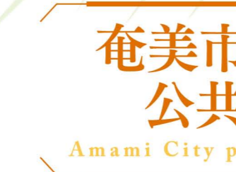
奄美市公設地方卸売市場