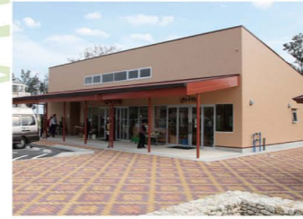
奄美市ひと・もの交流プラザ