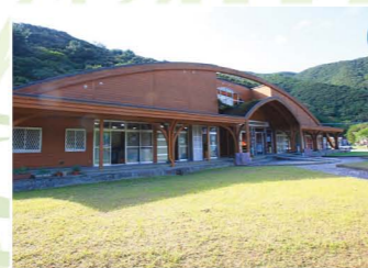
(財)奄美市農業研究センター