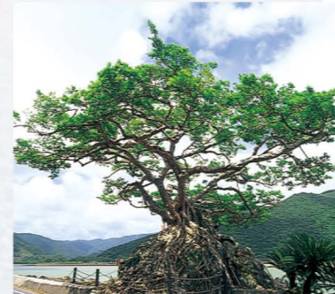
ガジュマル Banyan Tree