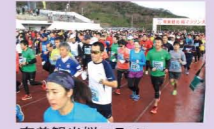
奄美観光桜マラソン