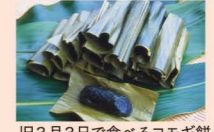
旧3月3日で食べるヨモギ餅