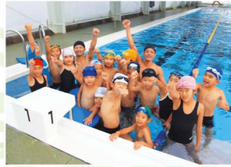
奄美市笠利B&G海洋センター