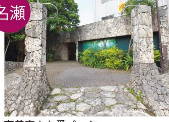
奄美市ふれ愛パーク