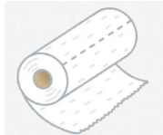
キッチンペーパー