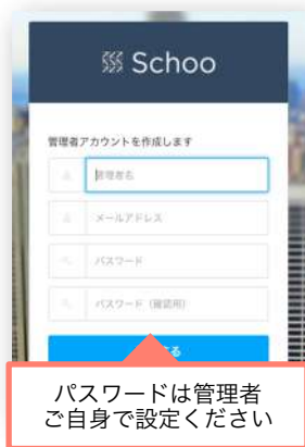
管理ツールログイン画面

Schooビジネスプラン開通のお知らせという件名のメール内URLよりログインして下さい。 メールの有効期限は14日間です。