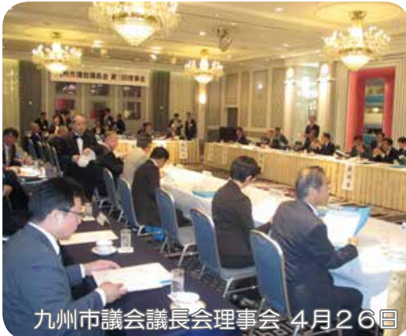
九州市議会議長会理事会 4月26日