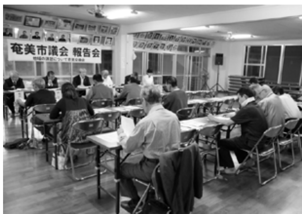
【名瀬会場】 (小宿地区集会場)