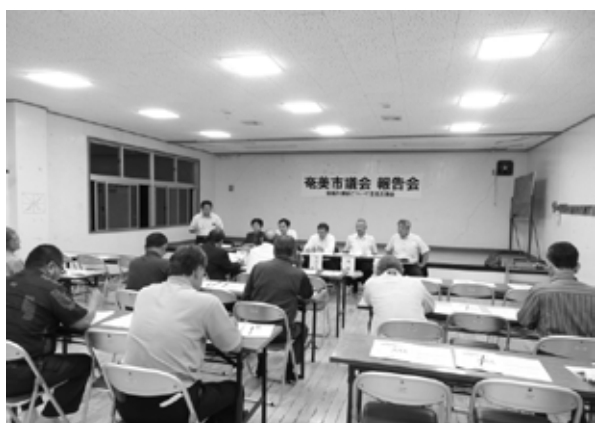
【住用会場】 (住用町高齢者コミュニティセンター)