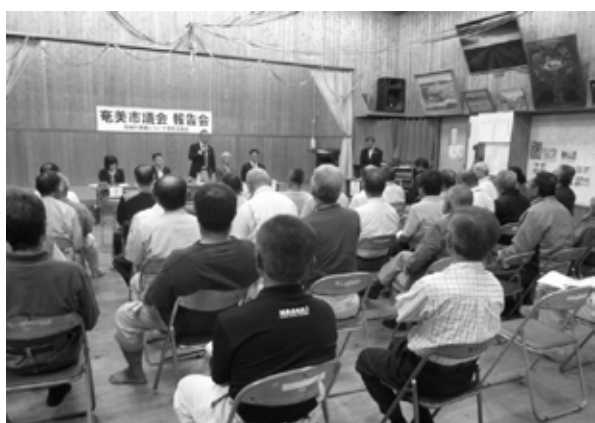
【笠利会場】 (大笠利文化センター)