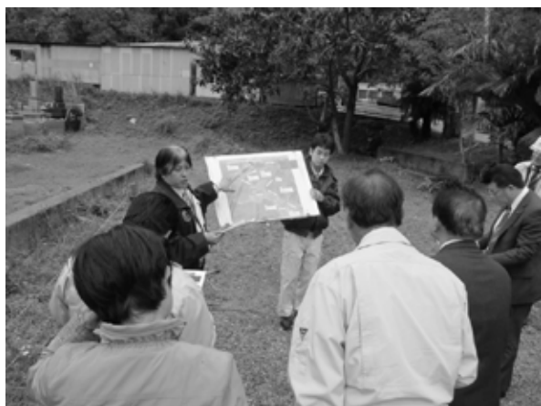
【自衛隊駐屯地水道整備事業】