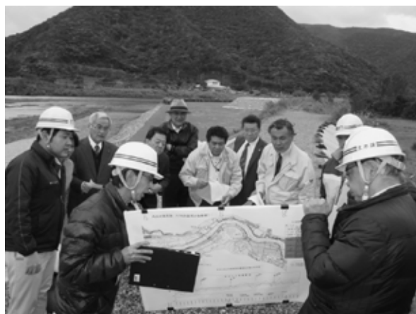
【住用川排水機場整備事業】