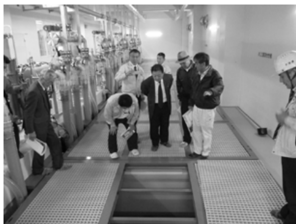
【平田浄水場更新事業】

住用川の排水機場整備事業、平田浄水場更新事業、自衛隊駐屯地水道整備事業について、各現場を訪れ、事業の概要について各担当者からの説明を受けた後、現場を視察し、各事業における進捗状況などの確認を行いました。