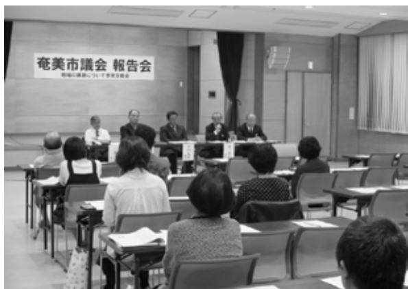
【名瀬会場】 (A i A i ひろば)