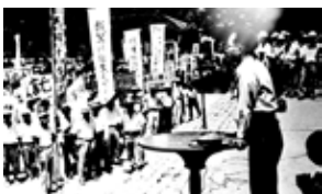
前小瀨学、小瀨芳、名前長、時衆議、動議協、運議協、復集復

答 財源を伴うことであり、群島他町村、奄美群島広域事務組合など協議を重ね検討していきたい。いずれにしても、奄美群島民の共有の貴重な財産であり、次世代に繋ぐ、我々の責務であると考え