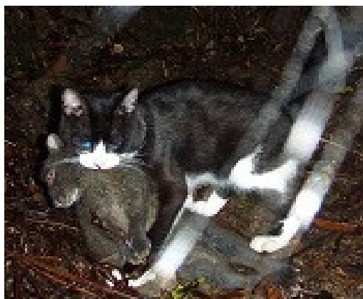
2008年6月27日 宇検村森林内 アマミノクロウサギ