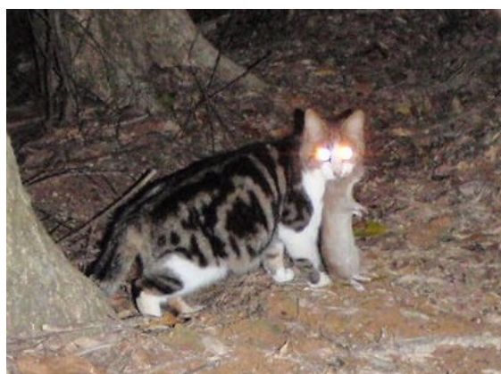
2012年3月12日 奄美市森林内 ケナガネズミ