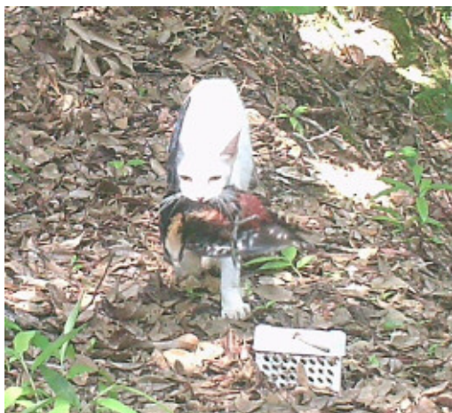
2014年6月7日 龍郷町森林内 オーストンオオアカゲラ