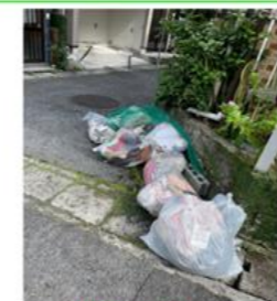
ごみは、「指定の袋」で出しましょう!