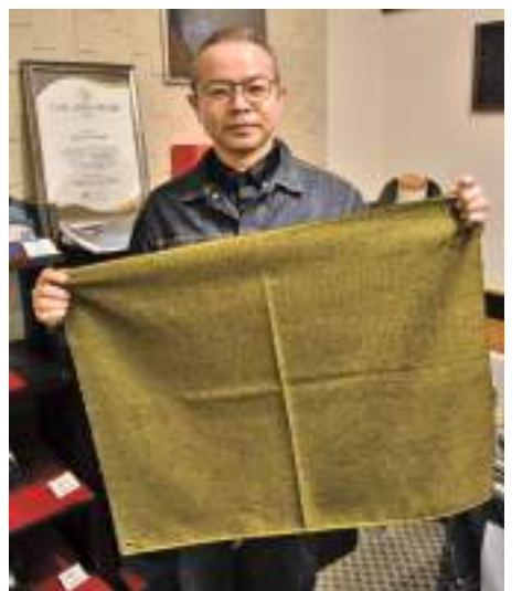
古い着物を「裂き織り」で新たに織り直したオリジナル生地「奄美布」＝1月21日、名瀬有屋町

島紬技術指導センターを見学した。そこで自分と同世代の若い研修生らが伝統技術の習得に励む姿を目の当たりにし、研修生の一人が、ジョン・レノンの顔を