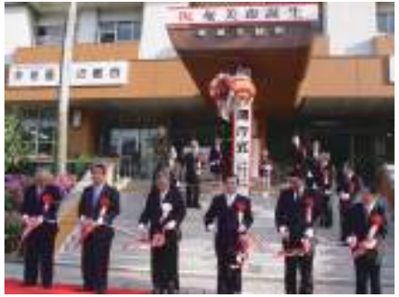
奄美市役所開庁式でテープカットする関係者＝3月20日

3月20日 名瀬、住用、笠利3市町村が対等合併し「奄美市」新設。(05年国調人口計4万9617人、名瀬4万1049人、住用1784人、笠利6784人)。奄美市役所本庁(名瀬総合支所)、住用総合支所、笠利総合支所が開庁