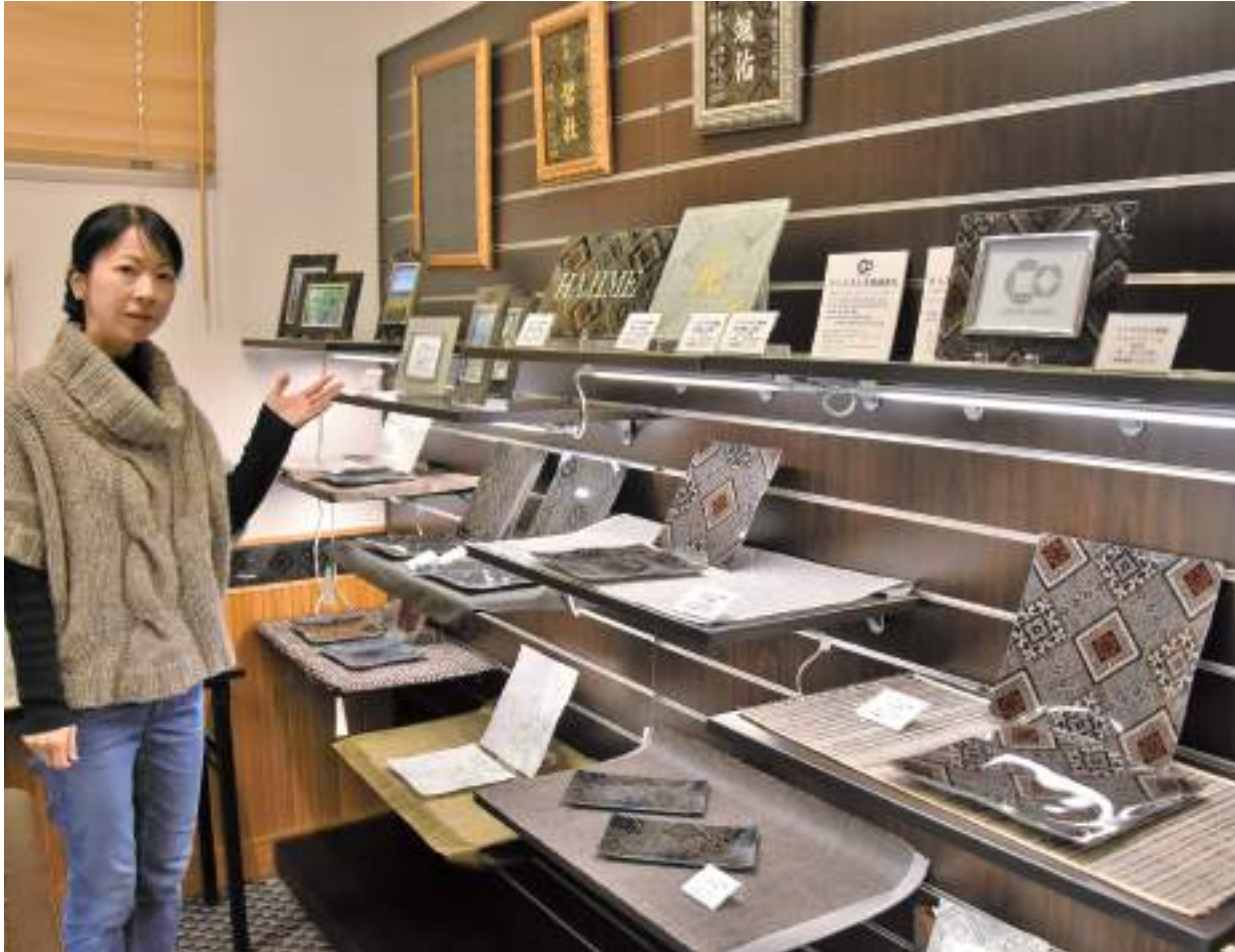
オリジナル商品を販売している、はじめ商事の工房＝1月21日、名瀬有屋町

はじめ商事は1982年、元さんの祖父で紬の立。元さんは名瀬で生まれ、84年に福岡県に支店