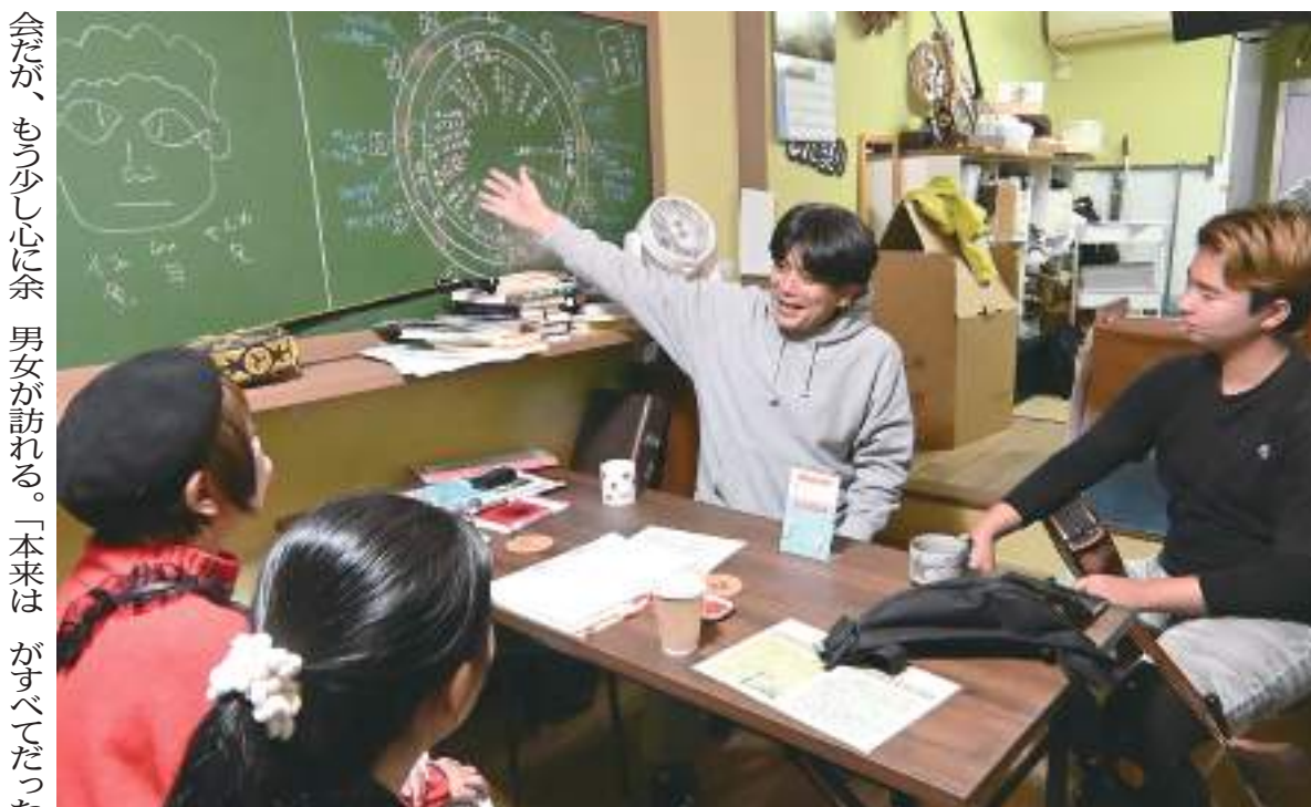
事務所の「ムルfee | BASE」は語らいの場。この日は県本土の高校生も訪れた＝1月23日、奄美市名瀬末広町

が希少な動植物などに集中してしまい、オーバートーリズムなどの問題が起る恐れもある。自然にも育まれてきた暮らしや文化こそが奄美の魅力。環境文化型観光にもっと力を入れるべき」と訴える。