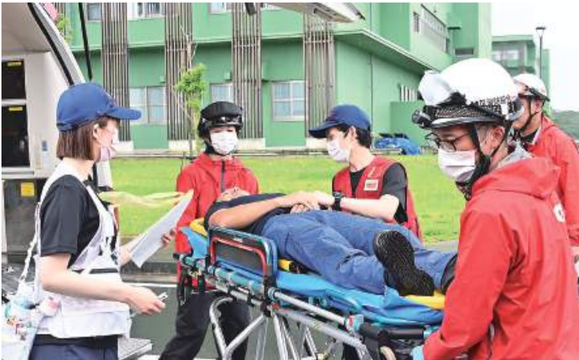
県防災訓練で行われた広域搬送拠点臨時医療施設(SCU)の設置訓練。2024年5月26日、奄美市名瀬の陸上自衛隊奄美駐屯地

奄美市市制施行から20年。奄美大島は2010年の奄美豪雨をはじめ、度重なる台風など、さまざまな自然災害に見舞われてきた。本土から遠く離れた離島という地理的制約の中、市民の命をいかに守るか。行政、警察、消防、自衛隊、気象庁、海上保安庁など多岐にわたる国・県の機関がそろい、日常的に顔を合わせる環境を持つ奄美市では、官民の枠を超えた多機関による「顔の見える連携」が進んでいる。「あの人の顔が浮かぶ」という信頼関係が、多職種の枠組みを超え、離島特有の課題に立ち向かうための防災モデル構築の可能性を広げている。