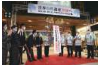
くす玉開きで世界自然遺産登録を祝う奄美5市町村長。11月26日、奄美市役所