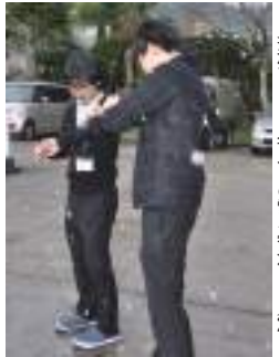
名瀬で115年ぶりの雪を観測。1月24日