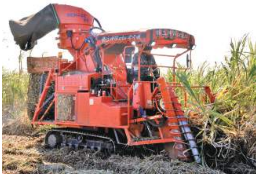
今年1月、新たに導入した中型ハーベスター＝2月3日、笠利町

ただ実際は仕事でうまくいかないこともある。「気持ち折れそうな時はキビ畑を眺める。キビは台風で倒れても必ず上を向くだろ」。担い手の熱い思いが、島の基幹産業を支えている。