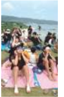
を人グラスの用をのの空を上げて見上げる 22日7月 7人=つちて食日

4月28日 大島地区衛生組合の有良汚泥再生処理センター竣工 5月15日 名瀬デジタルテレビ中継局が地上デジタル放送の試験放送開始 6月21日 奄美交通のバス事業、道の島交通（現しまバス）へ譲渡 8月1日 名瀬中継局から地上デジタル本放送開始 8月9日 奄美市で原爆慰霊祭。高齢化で最後。県原爆被害者福祉協議会奄美支部は解散 11月2日 旧3市町村合同の奄美市民体育祭を初開催。8地区対抗奄美大島北部で豪雨 11月6日 国の文化財保護審が「赤木名城跡」の文化財指定答申 11月24日 県立図書館奄美分館、閉館 11月24日 奄美市高齢者福祉計画・介護保険事業計画策定委、旧3市町村の介護保険料統一を答申 2月1日 第1回奄美桜マラソン（大勝小発着、本茶コース。973人） 2月5日 名瀬井根町で火災、19棟全半焼 2月9日 県教委、奄美高と大島工業高の統合決定 2月12日 文科省、赤木名城跡を国指定文化財に指定告示 3月25日 宇宿地区農業集落排水事業宇宿処理場完成、通水式 3月31日 参院で改正奄振法が成立 4月1日 名瀬佐大熊救急用ヘリポート運用開始 4月16日 本場奄美大島組協組の燃系工場休業 4月23日 県立奄美図書館開館 7月22日 皆既日食 9月18日 名瀬柳町で火災、8棟全焼 9月24日 奄美市、奄美大島の皆既日食経済効果試算「13億8千万円」