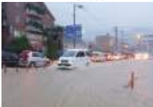
奄美市名瀬の中心街でも道路が冠水した＝10月20日、永田橋交差点