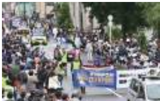
約4300人が沿道に詰め掛けた優勝パレード＝2月1日、奄美市名瀬