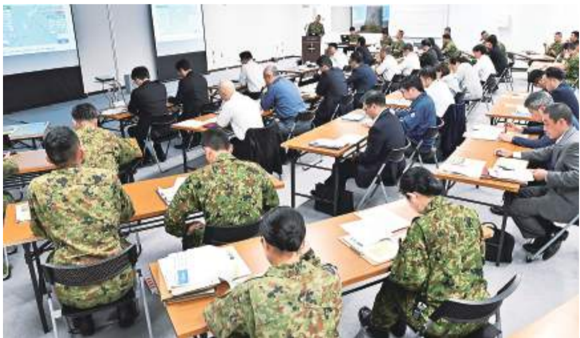
7機関が参加し、防災危機管理に関して情報共有を図った合同勉強会。2024年6月28日、奄美市名瀬の陸上自衛隊奄美駐屯地

■「空白期間」を生き抜く 24年5月、奄美市を中心に実施された鹿児島県総合防災訓練。マグニチュード8・2の巨大地震と大津波、さらに土砂災害などが重なる複合災害を想定し、80機関・団体の約1000人が参加した。訓練では、能登半島