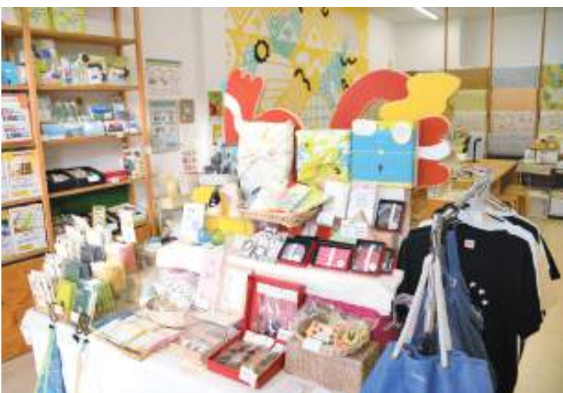
500品目以上の奄美のものを取りそろえたギフトショップ「okuru amami」＝1月22日、名瀬末広町

「人と人の中に入り、つ なぐことを自然と考える。 買い手と売り手をマ ッチングしていくのが僕 らの一つの特徴」とい う。ブログから始まった仮 説の検証は今後も続く。 「島にあるものを組み合 わせて情報として発信 し、それが皆さんに刺さ って島のファンを作る。 そんな循環ができれば」。 これまでのチャレンジを 周りが温かい目で見てく れたと感謝し、これから も挑戦できる島であつて ほしいと願っている。