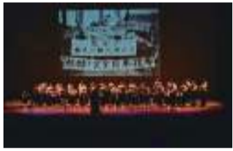
式典前のパフォーマンスで復讐を祝う歌「朝はあけたり」を合唱する名瀬市民合唱団と奄美市少年少女合唱団＝11月11日、奄美市名瀬