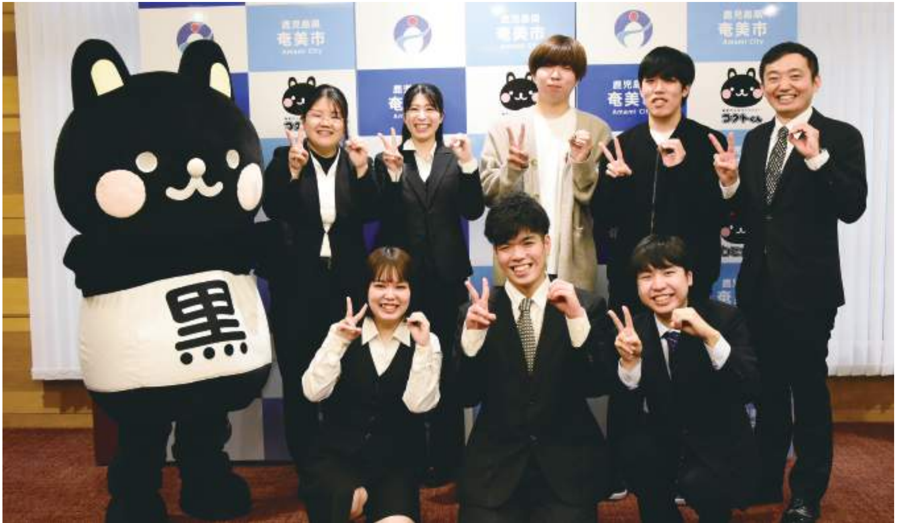
20周年を指で表す20歳の参加者と安田壮平市長