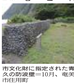
市文化財に指定された青久の防波壁＝10月、奄美市住用町