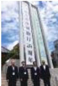
市制施行20周年を祝う懸垂幕＝8月29日、奄美市役所