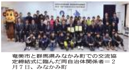
奄美市と群馬県みなかみ町での交流協定締結式に臨んだ両自治体関係者＝2月7日、みなかみ町