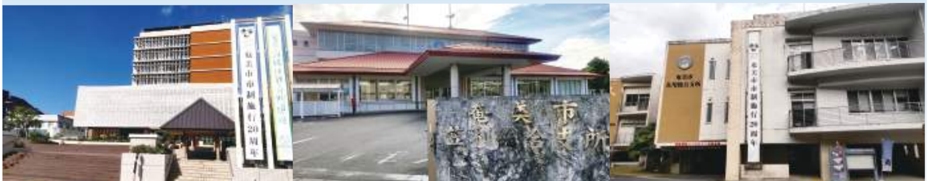
※画像・文章等の無断転載を禁じます