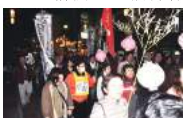
復帰60周年を祝う、ちょうちん行列＝12月25日