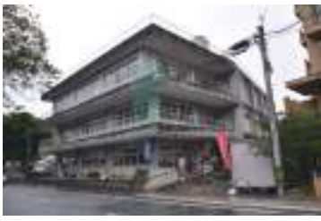
半世紀の歴史に幕をおろした名瀬公民館＝3月31日、奄美市名瀬

12月13日 農水省緊急防除省令に基づく島外移出規制始まる 12月24日 政府、16年度当初予算案閣議決定。奄振は3%減の226億円。交付金で奄美・沖繩の運賃低減通年化へ。奄美大島の陸自配備に86億円 1月24日 名瀬で115年ぶり雪観測。最低気温、筈利3・7度 2月10日 奄美大島海区漁業調整委員会、シラヒゲウニの漁解禁期間を2カ月(7、8月)に短縮 2月26日 総務省と県、15年10月1日実施の国勢調査速報を発表。奄美群島は11万215人で前回比7・2%減、奄美市は4万3184人で6・37%減 3月11日 国の文化審議会、小湊フワガネク遺跡出土品1898点の重要文化財指定を答申 3月20日 奄美市市制施行10周年 3月31日 「中央公民館」と親しまれた名瀬公民館閉館。50年余の歴史に幕 7月14日 ミカンコミバエの緊急防除省令を廃止。規制品目の島外移出全面解禁 12月26日 環境省の中央環境審議会が奄美群島国立公園の指定認める