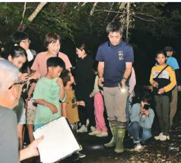
夏休みに奄美博物館が主催する「夜間いきもの観察会」 2025年8月9日、奄美市住用町

これからの10年、20年に向けての意気込みを尋ねると、「次世代を担う子どもたちに奄美の自然の面白さや価値を伝える継承活動と、生き物の記録の発信。島に住んでいるからこそ日々の記録を見逃さず、論文で報告するなどして、学術的に貴重なことが埋もれることがないように発信したい。それが島や市に貢献することにつながれば」と力を込めた。