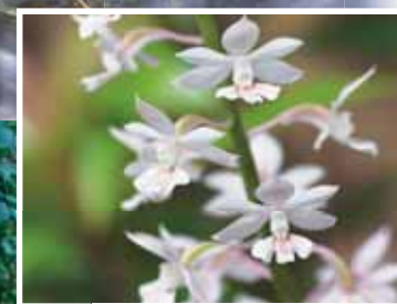
固有種アマミエビネ Amami Island Ebine (Endemic species)