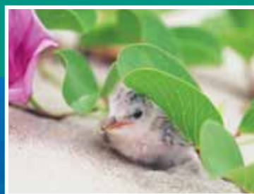
コアシサシの幼鳥 Little Tern chick