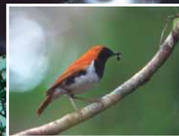
国の天然記念物アカヒゲ Ryukyu Robin (National protected species)