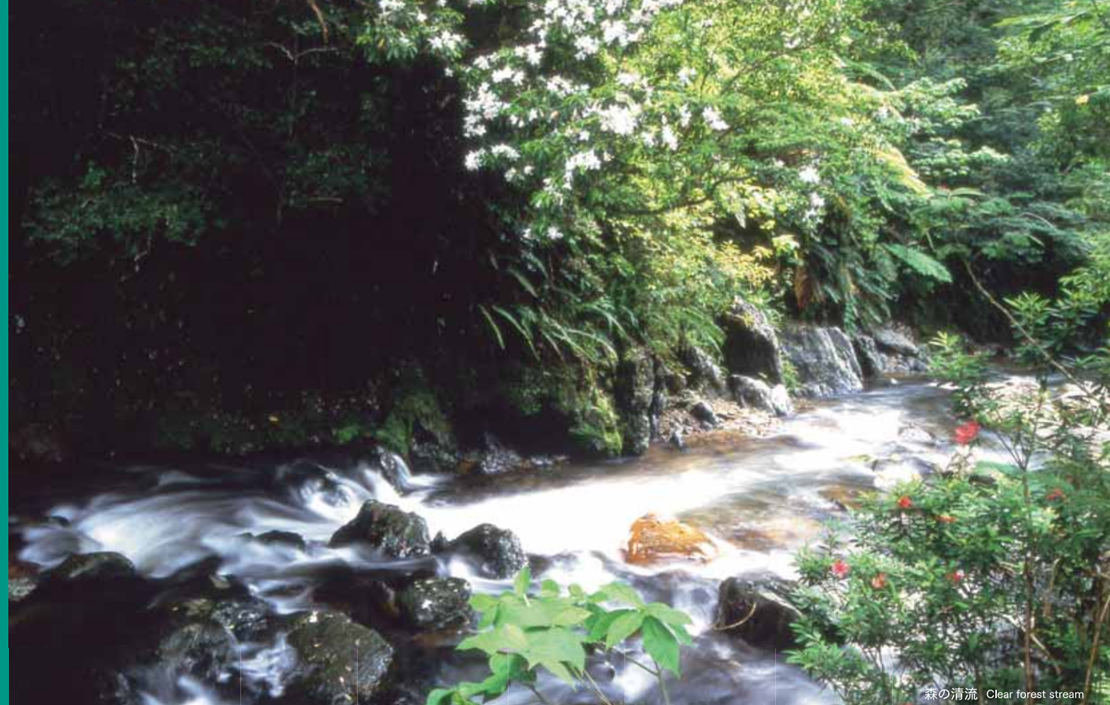
森の清流 Clear forest stream