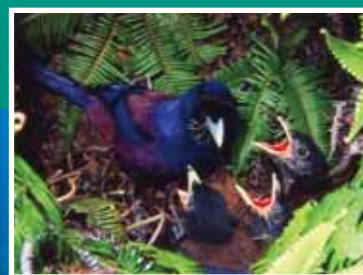
国の天然記念物ルリカケスの子育て Lidith's Jay mother and chick (National protected species)