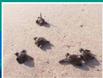
ウミガメの産卵地 Sea turtle spawning ground

A drama of diverse life plays out in our seas, forests and mangroves. We must continue to protect these precious living treasures handed down from our ancestors.