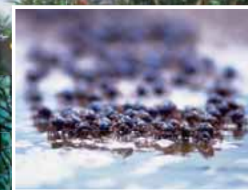
マングローブに棲むミナミコメツギガニたち Soldier Crabs inhabit the mangrove forest