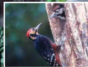
国の天然記念物オーストンオアカゲラの子育て Oston's White-Backed Woodpecker mother and chick (National protected species)