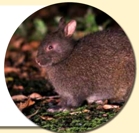
国の特別天然記念物 アマミノクロウサギ