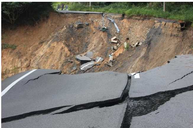
▼県道 602 号線 あかきなかわかみ 赤木名川上間