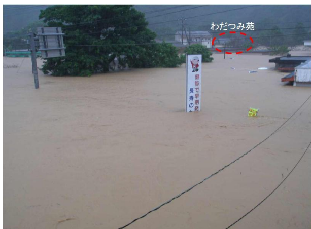
13 時 30 分頃

このうち、奄美市では住用町西仲間にあったグループホーム「わだつみ苑」の入所者 2 名が亡くなられた。(画像 3-1)また、笠利町では陥没した道路に転落し 1 名が骨折等の重傷を負われた。