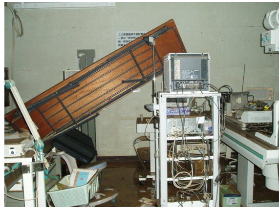
画像 3-7. 浸水後の奄美市住用国民健康保険診療所の状況