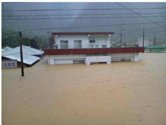
画像 3-6. 豪雨時の奄美市住用国民健康保険診療所の浸水状況(左：13時20分頃)