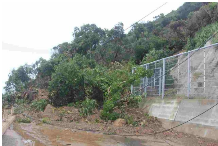
画像 3-3. 奄美豪雨災害での崩土による断線（笠利町 きに 佐仁）