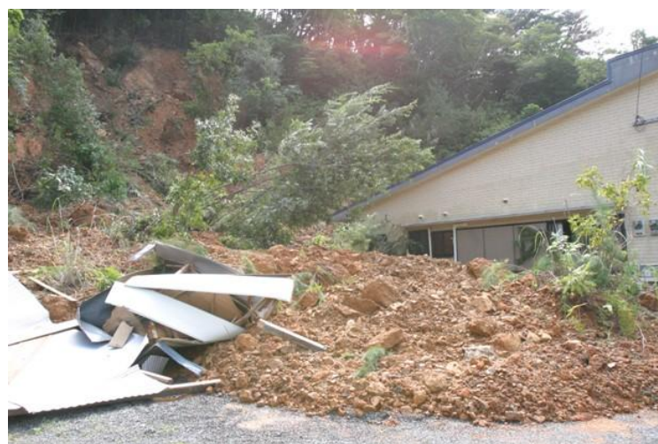
画像 3-2.家屋の被害状況 (住用町西仲間)