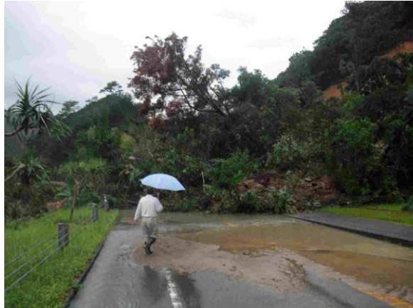
画像 3-4. 奄美市内主要幹線道路の被害状況