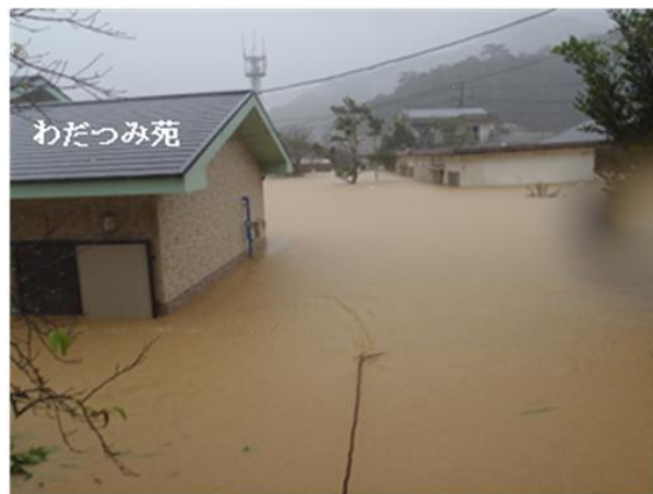
15 時 30 分頃