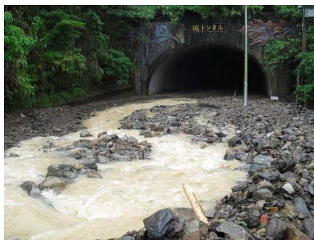
▼住用町城国道 58 号城トンネル