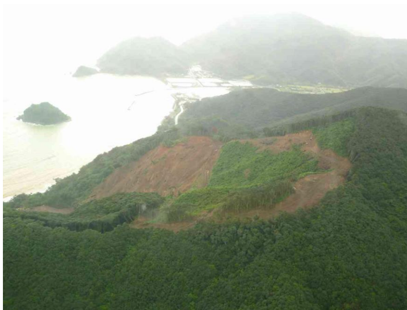
画像 3-5. 上空から撮影した林地の崩壊状況 (上空から市集落方向を撮影)