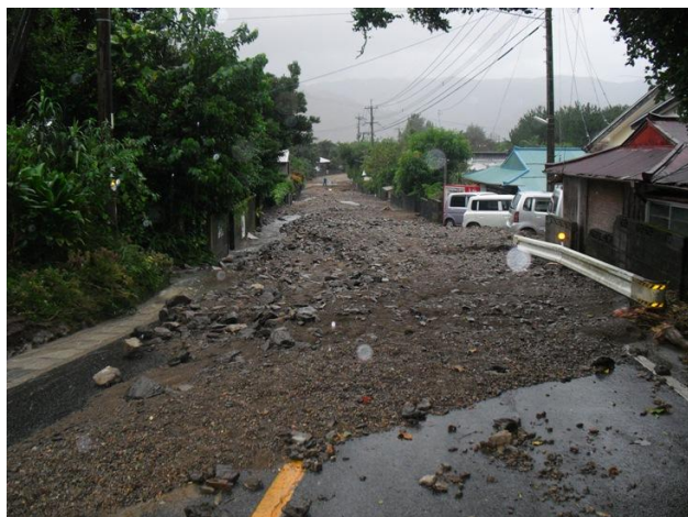
▼住用町 くすく 城 集落内国道 58 号