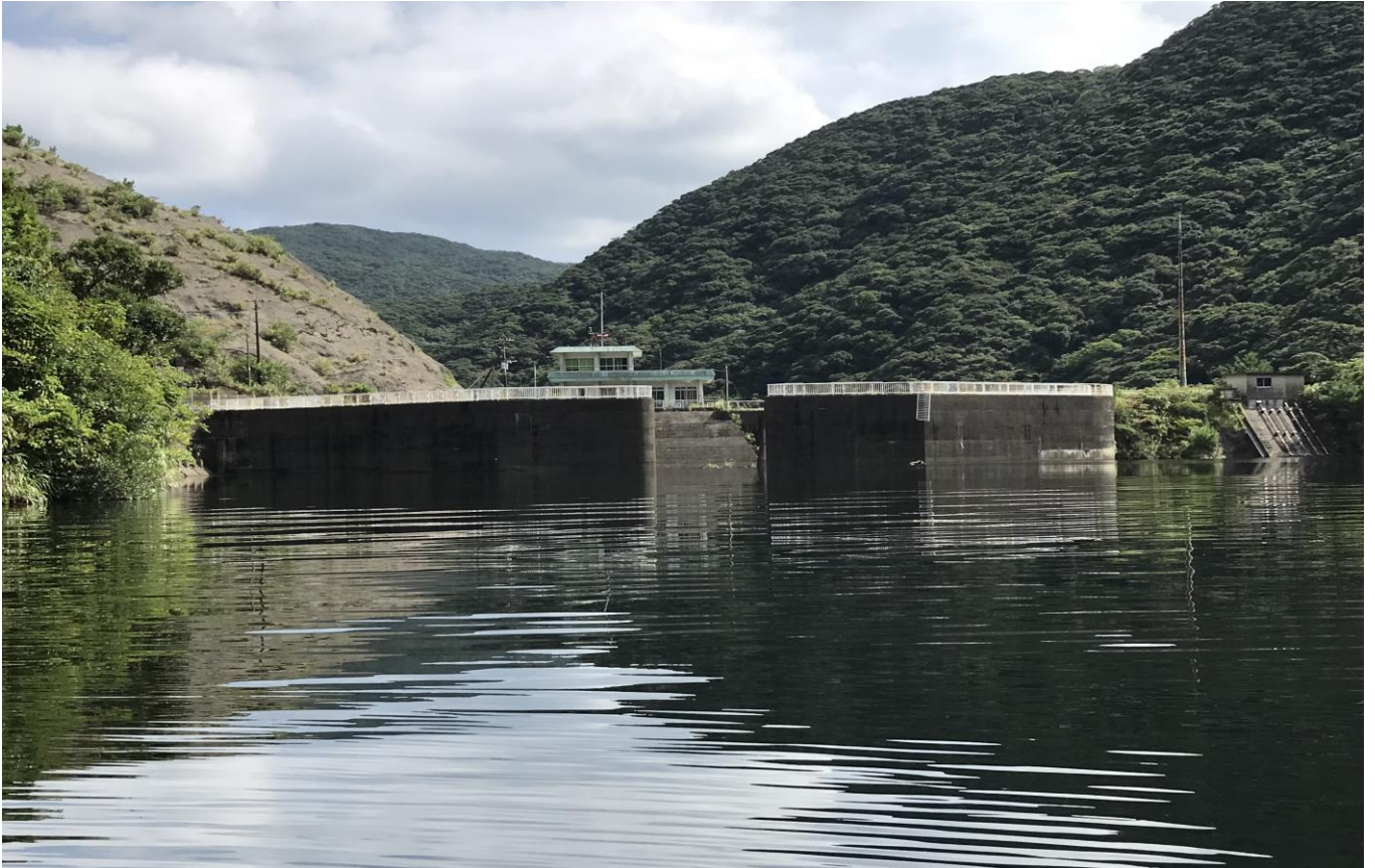
大川ダム水源（平田浄水場水源）